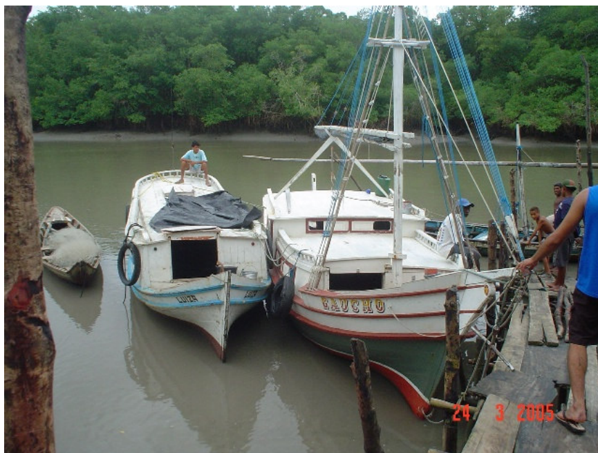
Figura 5: Foto das embarcações que fazem a travessia para a ilha.

Dessa forma, através da educação ambiental, pautada no ecoturismo, propõem-se possibilitar o contato da comunidade da ilha de Guajerutiua com o espaço natural no qual estão inseridos, de forma que as gerações futuras dessa localidade e visitantes possam usufruir dos benefícios naturais que ali estão.