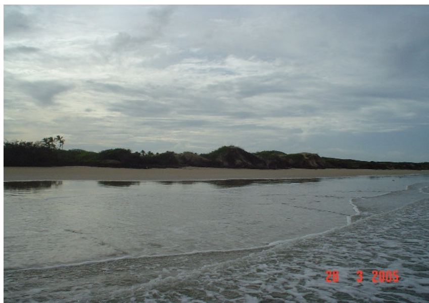
Figura 4: Foto da praia da Ilha de Guajerutiua

É importante salientar que a busca de qualidade de vida, tem levando inúmeros indivíduos a buscarem regularmente locais isolados com o objetivo de fugirem das pressões cotidianas. Outro aspecto, diz respeito ao imaginário coletivo que povoa as ilhas, (figura 04) isto porque, apresenta atributos naturais e também pelo fato de marcarem algum tipo de ruptura com a sociedade do continente.